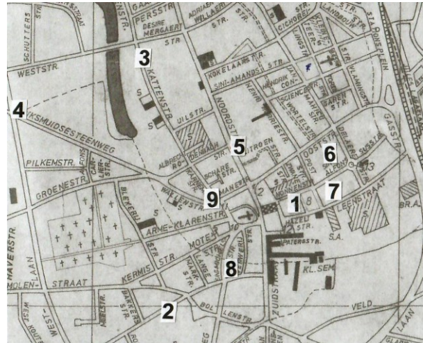
situering van woningen of ambachten van pijpenmakers in Roeselare centrum 18 de t/m eerste helft 20 ste eeuw (18 t/m 20A)