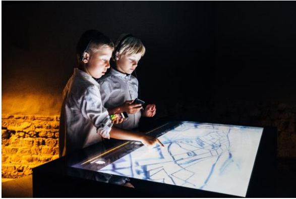
Interactieve kaart met de bouwkundige evolutie van de Tongerse binnenstad

De ervaring wordt door alle deelnemers als bijzonder goed ontvangen. Toch, we zijn een ervaren groep die reeds op heel wat plaatsen musea en tentoonstellingen bezochten en dus weten we meteen onze vinger te leggen op wat er toch schort. Wie gingen bezoekt onder de grond, wie daar voor het eerst rondwaalt, die is voorzichtig en wil vooral voorzichtig kunnen zijn. Als het dan te donker is, als je niet altijd ziet waar je je voeten kan zetten, dan geeft dat geen veilig gevoel. Los daarvan, de passages waren wel degelijk veilig en breed.