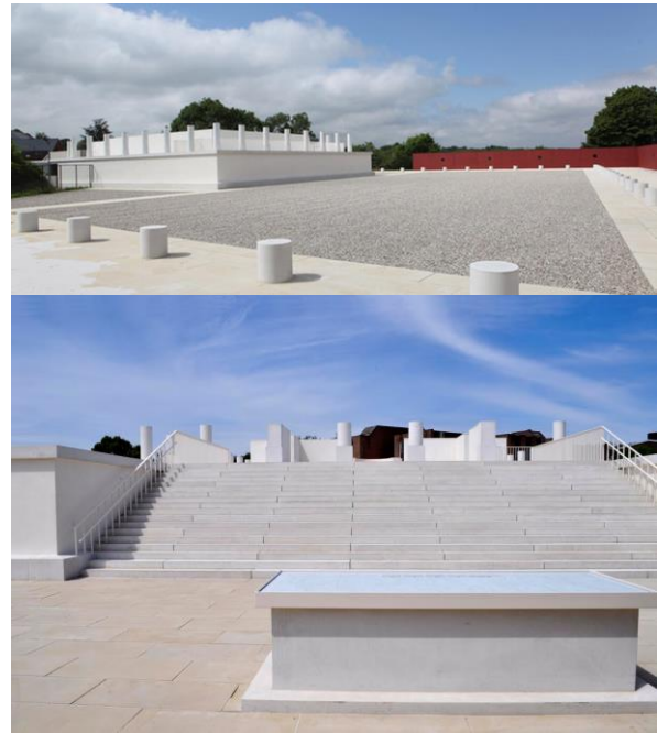
De 1:1 schaal reconstructie van de Romeinse tempel te Tongeren

rand van de stad, op een verhoogd platform binnen de toenmalige stadsmuur (de muur werd er eigenlijk later rondgebouwd). De gedeeltelijke reconstructie werd in het wit opgetrokken en contrasteert zo best wel gelaagd met zijn moderne omgeving. Zo goed als het kon, ligt de visualisatie bovenop de oude resten van dit ooit grootse tempelcomplex.