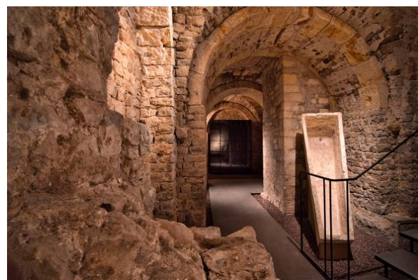
Eén van de gangen onder de Basiliek met onder meer een middeleeuwse sarcofaag

zeven kerken onder de huidige basiliek op. Van sommige fases betreft dit nog enkele gedeeltelijke muren, voor andere periodes sta je versteld hoeveel grote - zelfs tot op vandaag - structurele elementen de tand des tijds doorstaan hebben. Daar tussenin vond men ook heel wat Romeinse sporen; van de gebouwen die op deze plaats stonden voor de bouw van de kerken. Doorheen een uiterst verzorgd parcours wandelen we 3-4 meter onder de grond. Naast traditionele infoborden - zoals dat tegenwoordig verwacht wordt - werden er ook enkele interactieve installaties opgesteld.