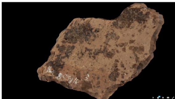
RAMS00419 - Neolithic sherd Kerkhove-Kouter

wereldwijd meest gebruikte platform: Sketchfab. De originele 3D datasets van beide scherven werden voor lange termijn preservatie van digitale informatie geüpload naar het platform Zenodo van het CERN/Europese Commissie en kregen respectievelijk de unieke digitale codes (DOI): 10.5281/zenodo.2555406 en 10.5281/zenodo.2555421.