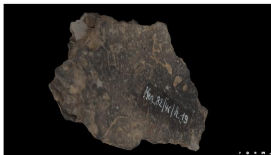
RAMS00421 - Neolithic sherd Kerkhove-Kouter

Beide Vroeg-Neolitische scherven uit Kerkhove-Kouter, voorgesteld als 3D model in de online repositorium Sketchfab.