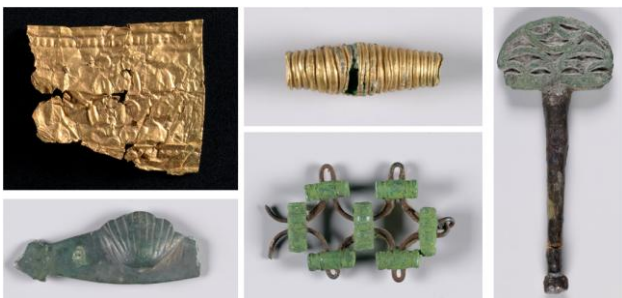
Fig. 3 – Voorbeelden van fotografisch gedigitaliseerde metalen voorwerpen opgegraven op de Kimmelberg, zie ook Charpy e.a. 2019.