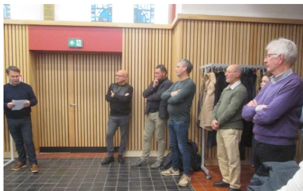
Fig. 6 – Deel van de aanwezigen.