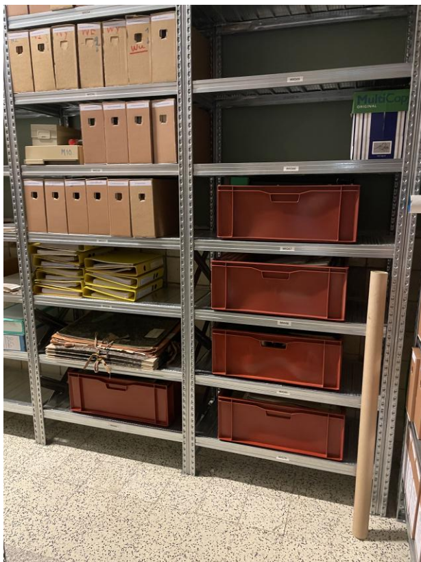
Fig. 5 – Archeologische documentatie en archieven van de V.O.B.o.W.-Kemmelbergcollectie.

Daar het gros van de archeologische vondsten reeds eerder naar het Erfgoeddepot DEPOTYZE overgebracht waren, was het belangrijkste laatste deel van de collectie dat nog overgebracht moest worden: de archeologische documentatie en de archieven. Op de dag van de overdracht werden ze toegevoegd aan het archief van de Gemeente Heuvelland te Wijtschate (Fig. 5).