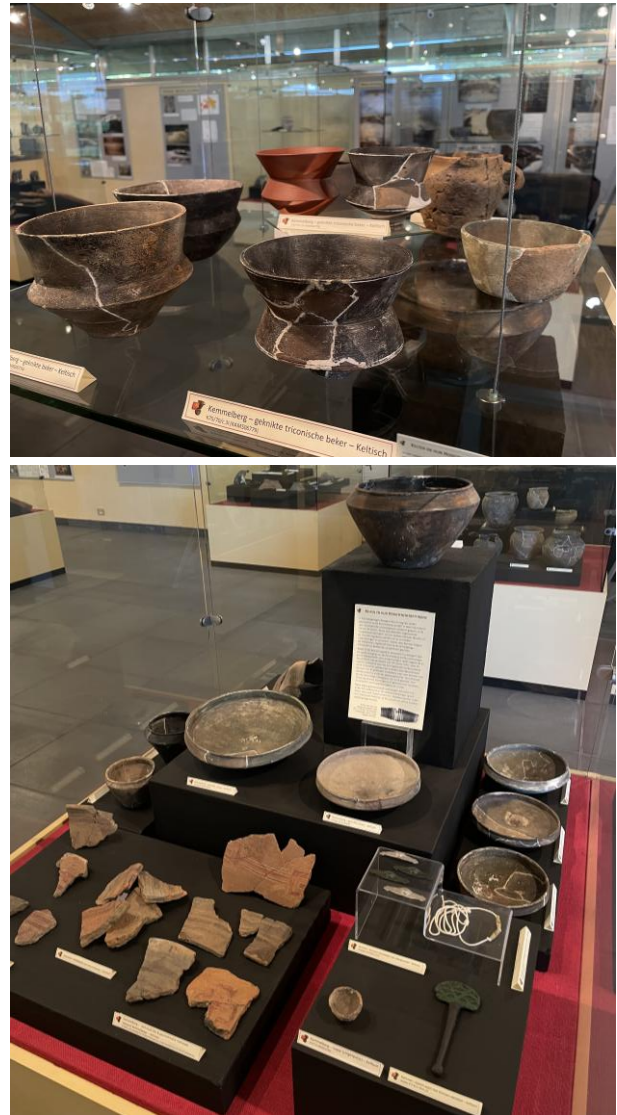
Fig. 9 - Permanente expo van Kemmelberg archaeologica in het RAMS te Waarmaarde