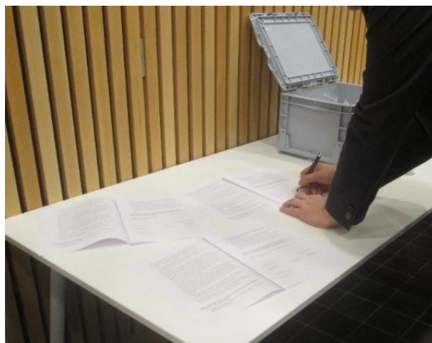
Fig. 8 – Handtekening van de overdrachtsovereenkomst.

Met de overdracht van de V.O.B.o.W.-Kemmelbergcollectie aan de Gemeente Heuvelland en met de daaruit volgende deponering, zijn alle bekende collecties van de archeologische prospecties en opgravingen van op en rond de Kemmelberg nu verenigd in het Erfgoeddepot DEPOTYZE te Ieper. Dit biedt nieuwe opportuniteiten voor hernieuwd onderzoek op