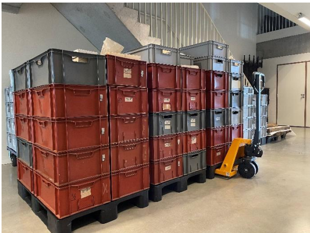
Fig. 2 – Boven: Euronorm bakken met daarin onderdelen van de V.O.B.o.W. Kimmelbergcollectie klaargezet voor transport te RAMS, Waarmaarde. Onder: Drie transpaletten vol met Euronorm bakken V.O.B.o.W. Kimmelbergcollectie samen na aankomst te Erfgoeddepot DEPOTYZE (24 juni 2022).