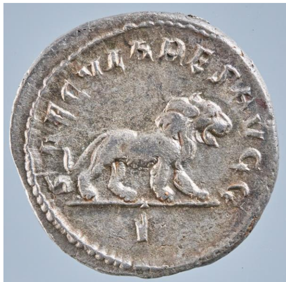
Keerzijde munt van Keizer Philippus I (Philippus de Arabier) 244-249 met wandelende leeuw.