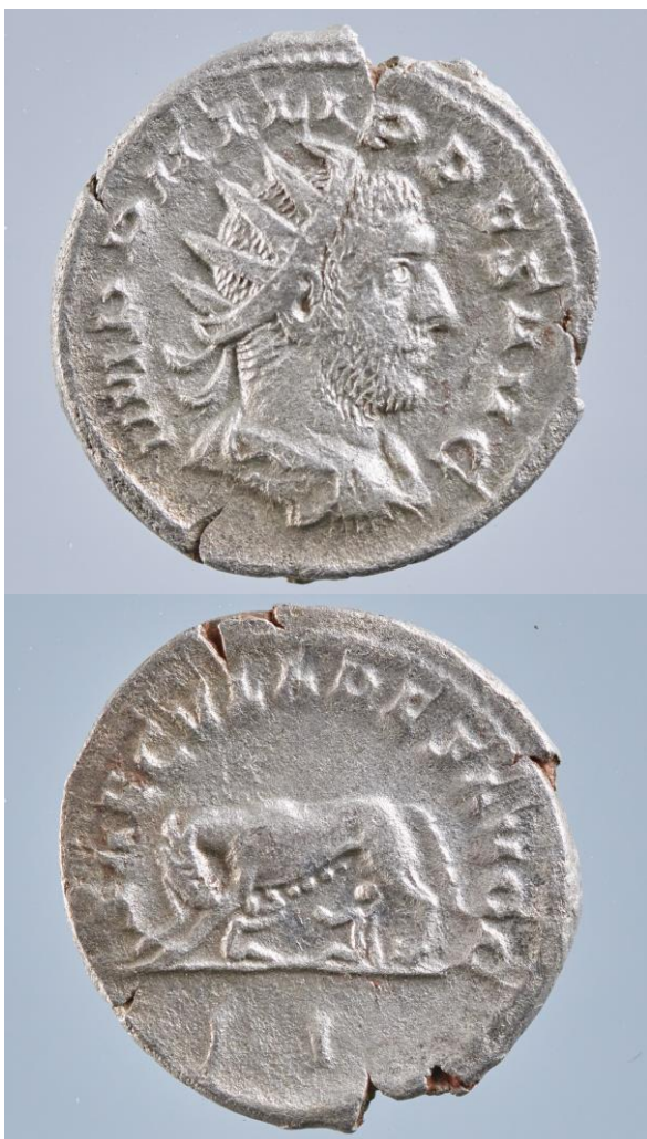
Munt van Keizer Philippus I (Philippus de Arabier) 244-249 met op de keerzijde de zogende wolvin met Romelus en Remus, een verwijzing naar de stichting van Rome.

De munten zijn zo goed als allen in uitstekende staat, niet verwonderlijk daar ze een zilverlegering zijn (weinig corrosie). Toch is dat niet het geval bij alle exemplaren, en dat is dus hoofdzakelijk te danken aan de onzuiverheid van de zilverlegering. In één geval zijn er nog drie munten die aan elkaar zijn blijven klitten. Daar ze moeilijk van elkaar los te maken zijn zonder geavanceerde conservatie-technieken, blijven deze dan ook voorlopig samen.