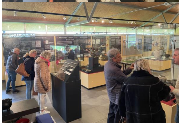
Bezoekers tijdens Erfgoeddag 2023 inspecteren de Gallo-Romeinse munten.