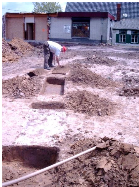
Noodopgraving in Sint-Denijs na afbraak van de Tap.

Maar door de steeds grotere inbreng van de digitalisering in de archeologie en in het collectiebeheer van het Museum heeft hij als computer-analfabeet zich gaandeweg ingewerkt en gespecialiseerd in het inscannen van de foto's, dia's en plannen. Met die kennis scande en inventariseerde hij ook zijn eigen uitgebreide foto- en diacollectie waarmee regelmatig hij zijn medewerking verleende aan publicaties over Sint-Denijs.