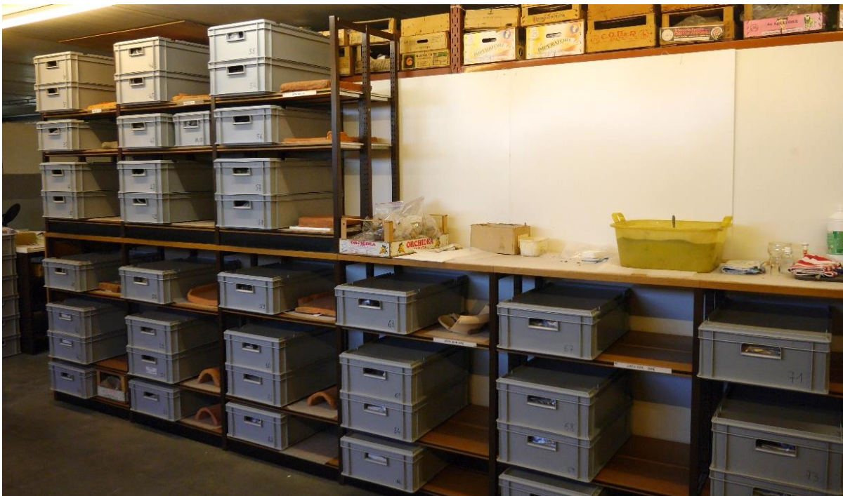
Achter (te RAMS is dat 'onder') de expositie zit uiteraard een archief en archeologisch depot waar wekelijks vrijwilligers aan het werk zijn