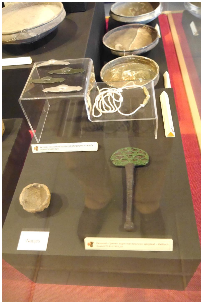
Uit de Kemmel de intussen beroemde bronzen wagenaspin