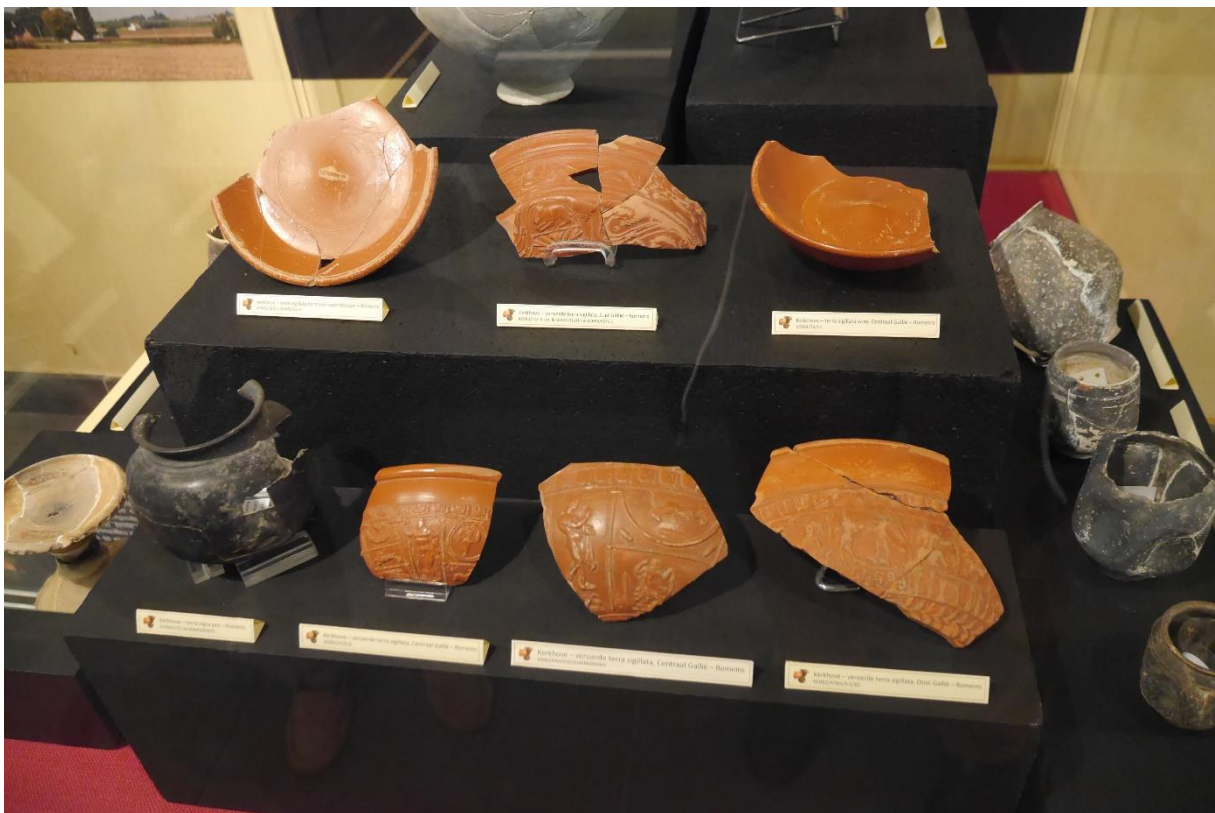
Gallo-Romeins luxeaardewerk van de site Kerkhove-Kouter