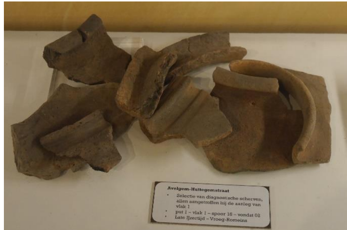
Brons- en ijzertijd in de West-Vlaamse Scheldevallei