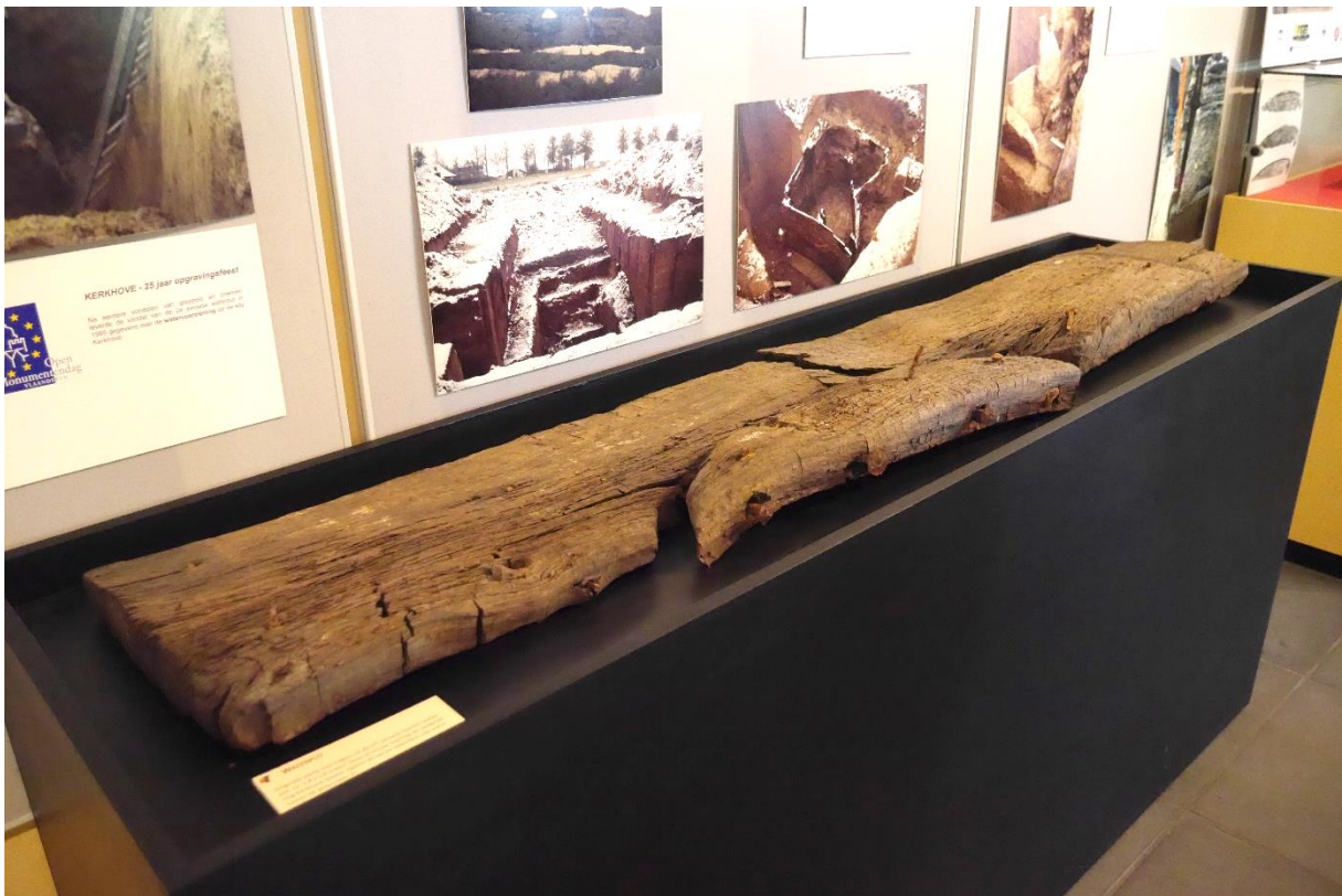
Een gerepareerde plank uit een Gallo-Romeinse waterput te Kerkhove-Kouter