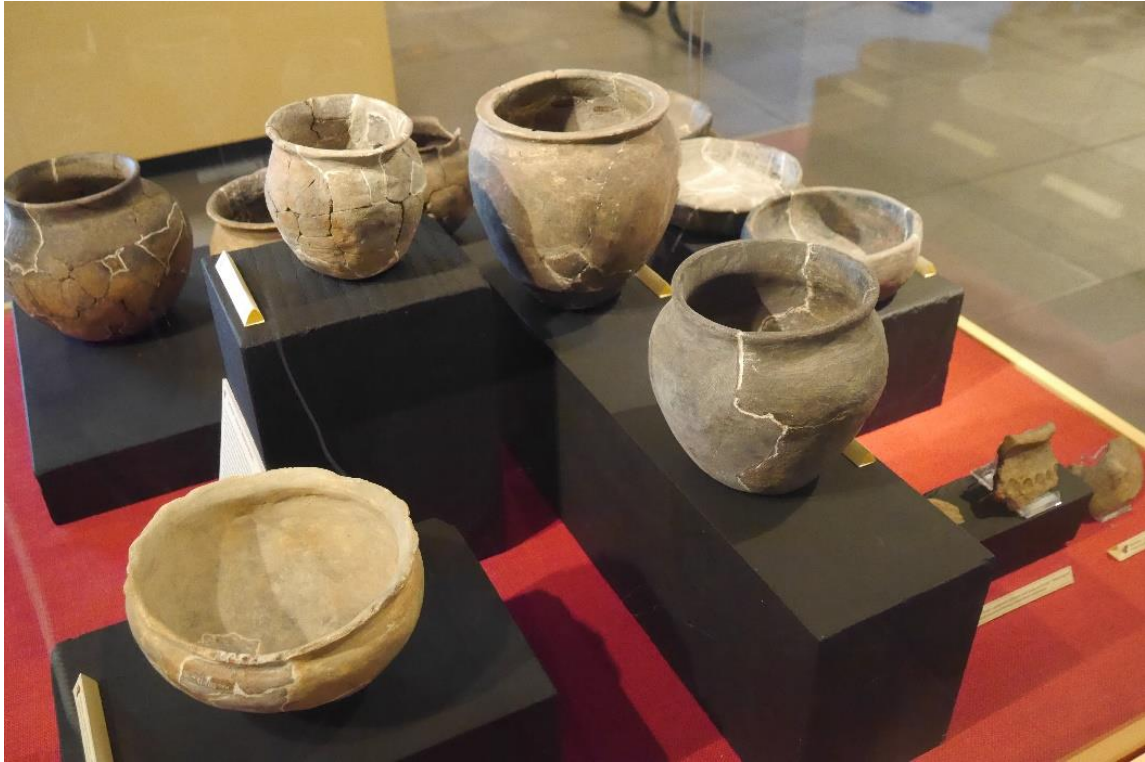
Laat Gallo-Romeins en Merovingisch aardewerk