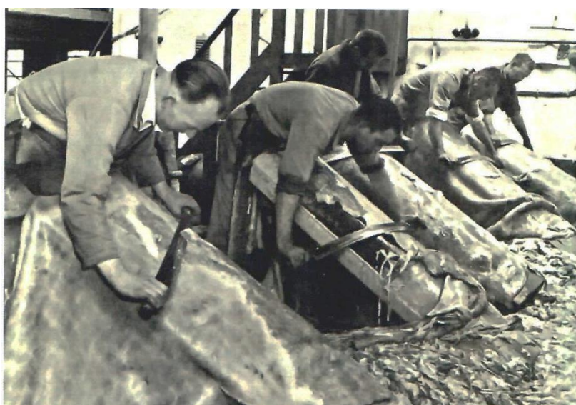
Ontharen en ontvlezen op een looiersboom was nog lang gangbaar in de leerbewerking.

Een leerlooierij is een recentere benaming voor huidenvetterij. De leerlooier was iemand die de huiden verwerkte tot leer. Die huiden werden daarbij ingesmeerd met vet. Door de onaangename geur die huidenvetterijen verspreidden, lagen die werkplaatsen doorgaans aan de rand van de stadcentra. Dit was hier in Roeselare ook het geval. Bovendien hadden die bedrijven veel water vandoen (Aneca, straatnamen).