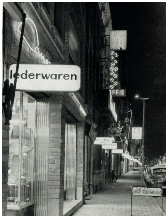
Roeselare Noordstraat foto van omstreeks 1967.

Winkel in dezelfde straat waar vroeger leerlooiers gevestigd of werkzaam waren.