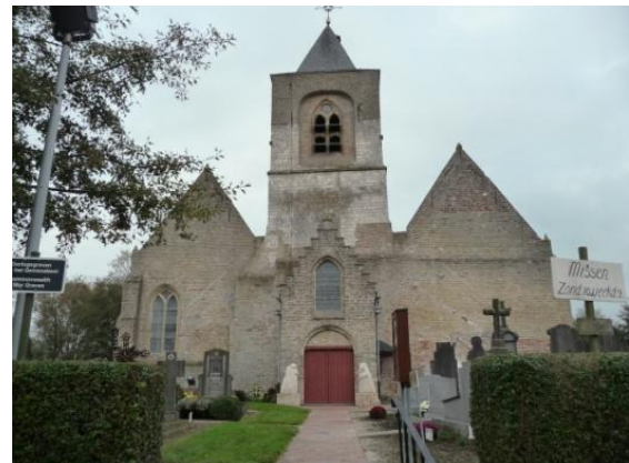
Façade en toren van de St.-Laurentiuskerk te Steenkerke

Tijdens de busrit kunnen wij nog een mooie glimp opvangen van het neoclassicistisch kasteel St.-Flora. Opgericht in 1851 voor dhr. Moissenet; oorspronkelijk als jeneverstokerij ontworpen, maar als hoevegebouwen benut. Wij vernemen dat het tijdelijk de verblijfplaats was van de Koninklijke Familie tijdens WO I en dikwijls het toneel was van belangrijke ontmoetingen tussen staatshoofden en soms ook van meer 'romantische' en verdoken gebeurtenissen.