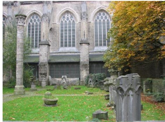
Lapidarium aan de noordzijde van de St.-Maartenskerk

1918 vernielde kerk. Het vormt een 15de-eeuws gotisch overblijfsel van de 12de-eeuwse St.-Maartensproosdij.