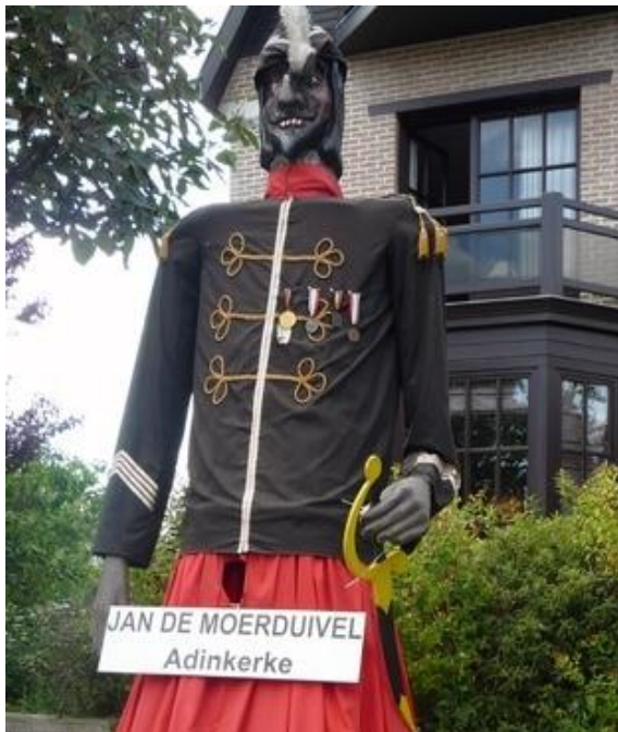
Reus Jan de Moerduivel uit Adinkerke

"Waren het achtergebleven Spaanse soldaten of grijpt de naam terug naar de tijd toen er turf werd gestoken in de Moeren. Hiervoor werden gevangenen (rabouwen) als een soort dwangarbeiders ingezet. Zij leefden en woonden tussen de turfhopen. Hierdoor hadden zij permanent een donkere huidskleur. Bovendien waren dit, gezien hun verleden, keiharde kerels (duvels) die enkel leefden om te overleven en waren hun huid en kledij doordrongen van de stank die de turf en rottende bestanddelen uit de Moeren verspreidden.