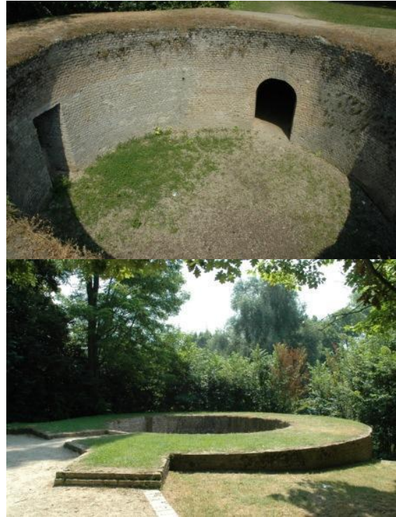
Restanten van de Predikherentoren

geschutplatform. Voor de toren ligt in de brede Majoorgracht, een driehoekig eiland als voorversterking. Aan het Kruitmagazijn nemen we met een applaus afscheid van deze deskundige gids.