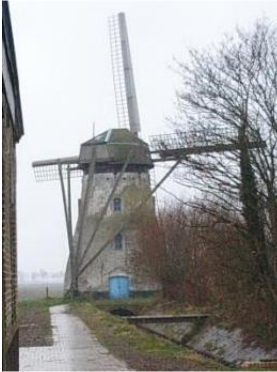
De St.-Karelsmolen in De Moeren in de Debarkestraat.

In 1746 kreeg de Franse graaf d'Hérouville uiteindelijk toestemming het Franse deel van De Moeren droog te maken. Het water werd ditmaal met een soort stoomgemaal weggepompt en via een speciaal afwateringskanaal in zee gespuid. Na twee jaar lag het grootste deel van het gebied opnieuw droog. Enthousiast door dit succes verkreeg d'Hérouville in 1760 toestemming ook het Oostenrijkse deel te ontwateren. In 1766 was ook dit werk voltooid. De verkaveling volgde grotendeels het patroon van de eerste droogmaking door Cobergher. De waterhuishouding werd nu geregeld door 14 windmolens. Nog voordat de kavels goed en wel door de in geldnood verkerende d'Hérouville uitgegeven waren, zorgde een dijkbreuk in 1770 ervoor dat het gebied opnieuw blank kwam te staan. De graaf ging hierdoor bankroet, net als Cobergher een eeuw voordien.