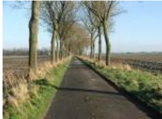
Een typisch zicht in De Moeren

Recent geologisch onderzoek door o.a. prof. Cecile Baeteman schijnt dit te weerleggen; er was immers geen veen aanwezig in de binnenmoeren enkel in de buitenmoeren, te zien aan de zwarte kleur van de aarde. Zijn ze gegroeid uit een oude zeelagune afgesneden door de Cabourduinen in de jaren 1200? 1