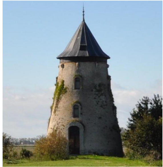
De wiekenloze St.-Gustaafsmolen in De Moeren in de Debarkestraat.

concessie van Vandermey behoorde, succesvol ingepolderd. Vandermey sloot daarop in 1787 een contract met hen om ook de rest in te polderen en dit lukte.